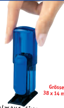
Größe 38 x 14 mm